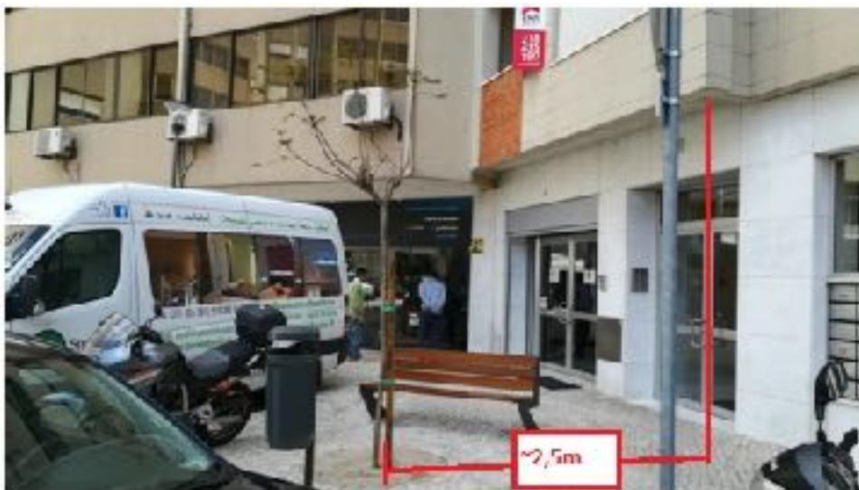
1 - Jovem jacarandá plantado a pouca distância da varanda do edifício.

O CDS-PP entende que as árvores constituem um elemento fundamental e estruturante da cidade. São elemento de bem estar e ligação com a natureza, fornecem sombra, oxigénio e são importantes factores de regulação de temperatura. A implantação de arvoredo requer respeito pela liberdade de desenvolvimento da árvore consoante as características da espécie escolhida e planeamento a longo prazo a fim de evitar conflitos com cidadãos ou com aspectos funcionais da cidade como a circulação automóvel ou ensombramento excessivo e proximidade de habitações.